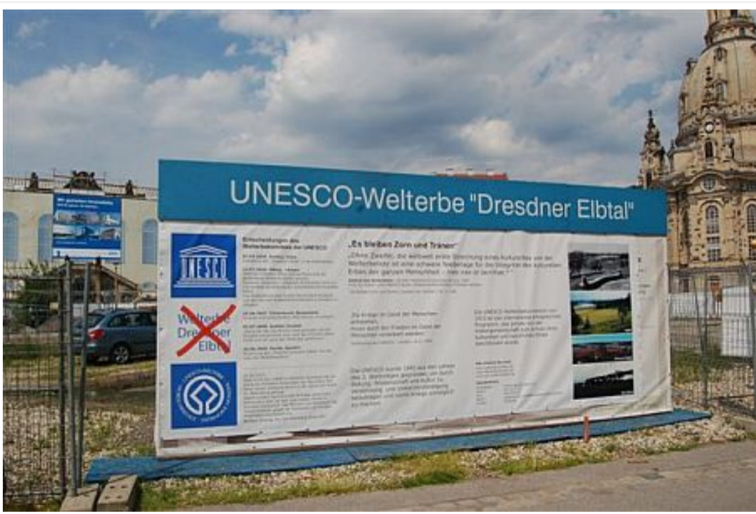
Nach 11:00 Uhr wurde eine Infowand am Welterbe-Info-Punkt Frauenstraße, Ecke Neumarkt, angeschlagen.

Die Druckvorlage für die Infowand stellen wir gern als .pdf-Datei (300 dpi, 1.216 kB) zur Verfügung.