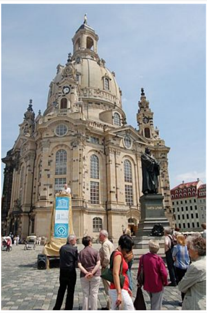
Von 09:00 Uhr an wurden stündlich Passagen aus der UNESCO-Welterbe-Konvention in verschiedenen Sprachen verlesen.