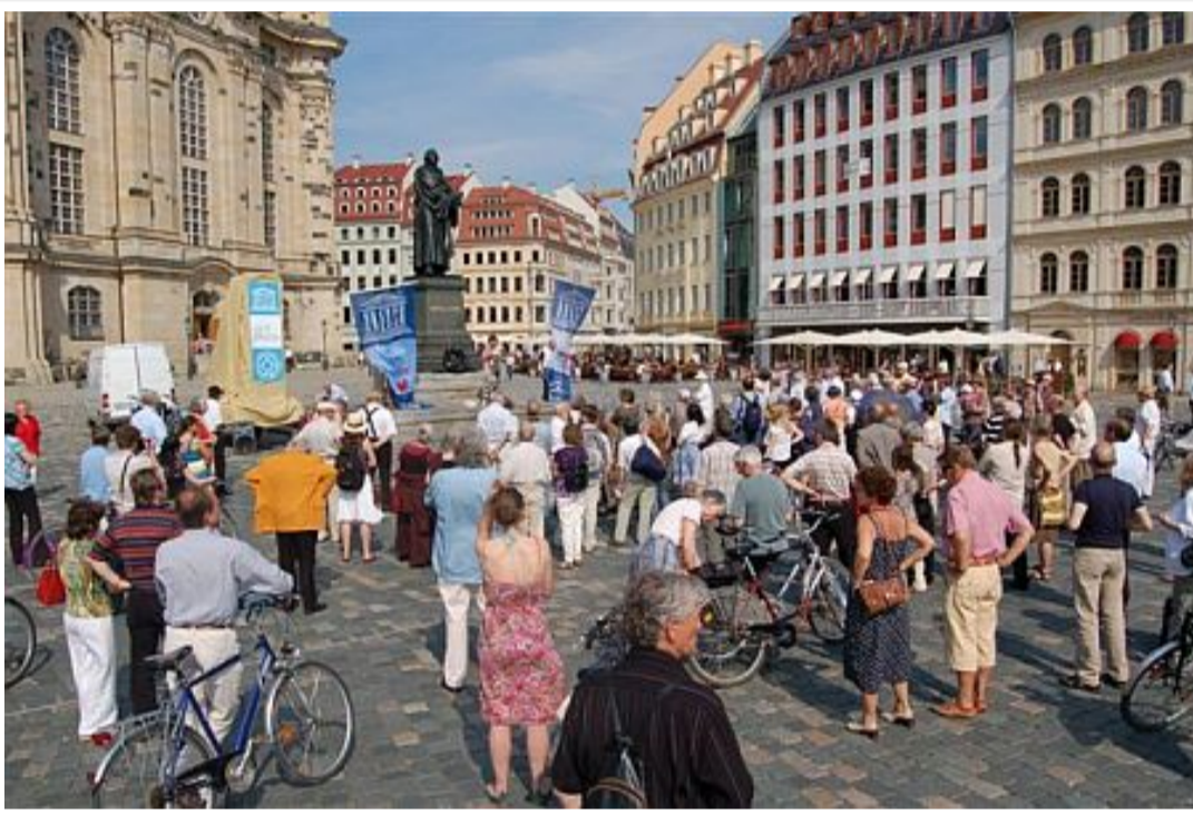
Kundgebung um 16:00 Uhr