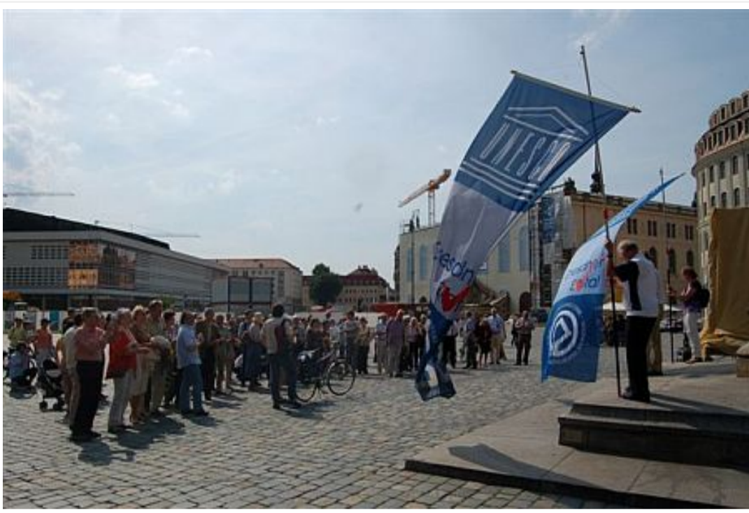
Kundgebung um 16:00 Uhr